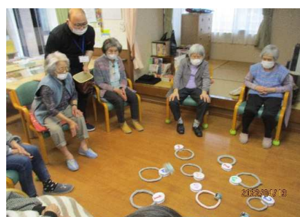
事業所内活動(レクリエーション)