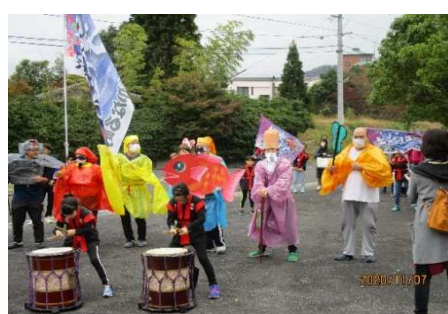
地域交流(福祉の里文化祭)