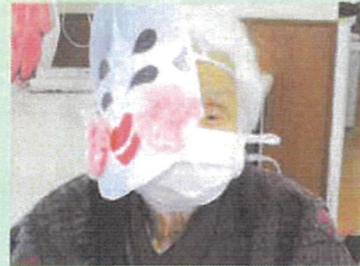
お手製のお面です