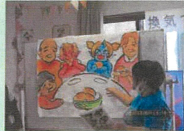
大きな紙芝居が登場しました