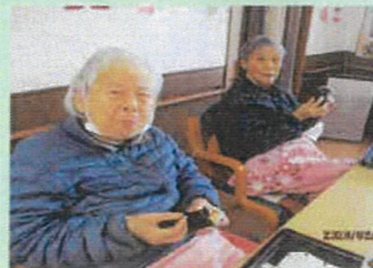
恵方巻おいしいな〜