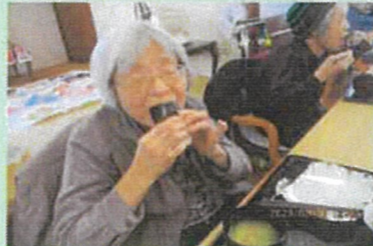
豪快にかぶりつきます