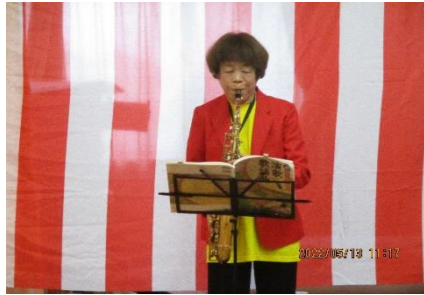
お祝いと感謝の気持ちを楽器に 込めて職員が演奏します。

おかげさまで12周年を迎えることができました。 ご利用者様、ご家族様、そして地域の皆様に感謝・感謝です。