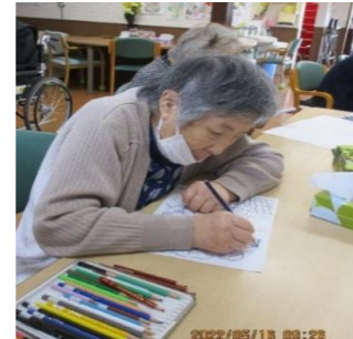
色塗りもとっても丁寧！ やしろ美術館に展示予定です～