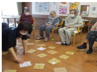
絵合わせゲーム！ 「あれ～こっちな～？」