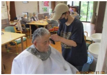
月に一度の散髪サービスよっ！男前～！！