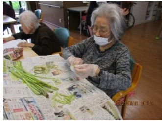
山ぶきの筋取りをしていただき、美味しくいただきました。