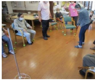
レクリエーションのゲートボール！目指せホールインワン♪