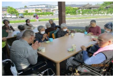
外でのお茶もとってもおいしい～ 「おやつおかわり!!」