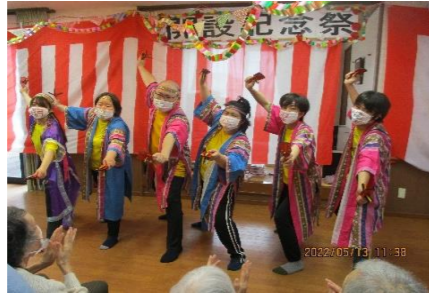
職員の全力ソーラン！！