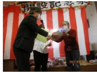
誕生会も並行して行われました！