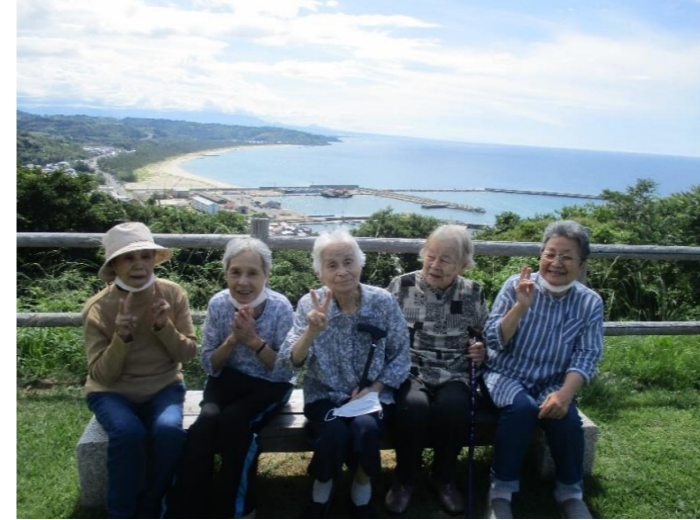
天気も良く泊へドライブ 笑顔で「はい！チーズ！！」