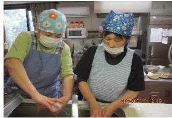
開設記念限定の特別メニュー！！ う〜ん〜！！とっても美味しそう〜！！