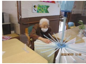
洗濯干しも上手よ～♪