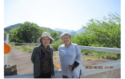
思い出に残るドライブになりました。