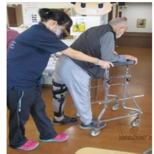
リハビリだって怠りません 「1・2、1・2もう少し！！」