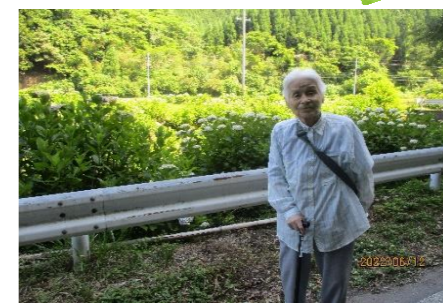
緑の木々でリフレッシュ〜 アジサイも最高〜！！！！！！