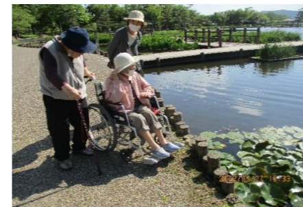
あやめ池で睡蓮の花発見！ とってもステキでしたよ〜