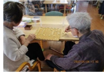
やしろで竜王戦！？ 勝敗はいかに！！