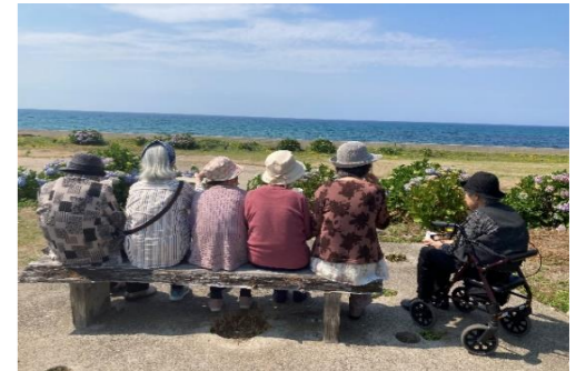
海をみんなで眺めてます あ〜青春だな〜！！！！