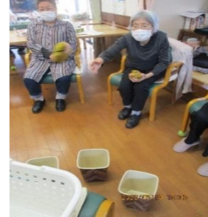
お手玉を投げて点数を競い合います！ 優勝は誰の手に～！