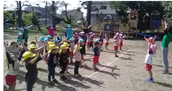
マラソンやラジオ体操をしながら体力づくりに頑張ります。