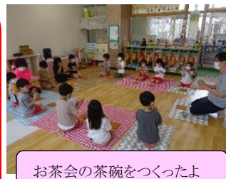
お茶会の茶碗をつくったよ