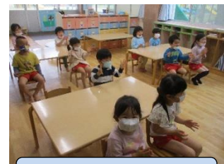
お話をしっかり聞くよ。