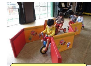
三輪車も楽しいね。