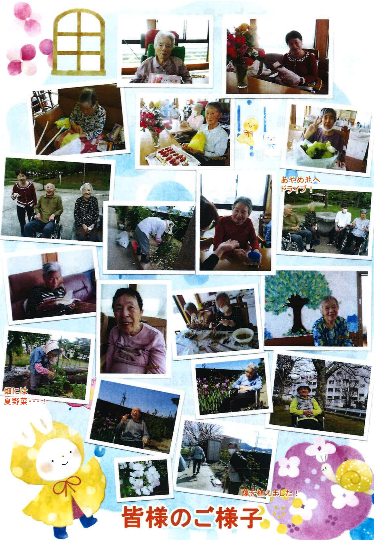
あやめ池へ ドライブ!