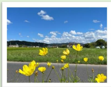
「青空と黄色いコスモス」