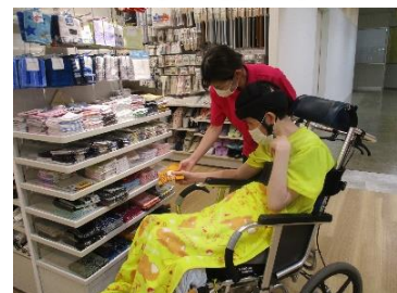
スーパー・ショッピングセンターに買い物