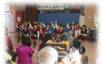
保育園児さんとの交流