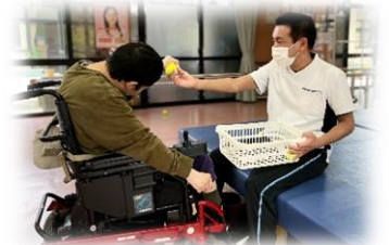
作業療法士による機能訓練