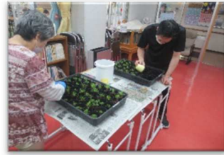
ピオラの苗づくり