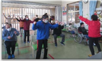
体を動かすことからスタート