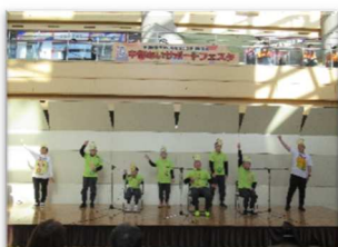
「あいサポートフェスタ」での発表