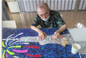
巨大ちぎり絵作成中