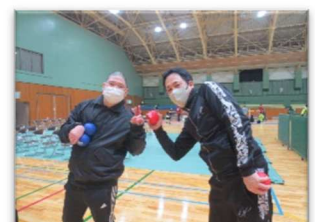
ボッチャ大会にて