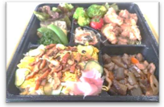
行事食「手作りお弁当」