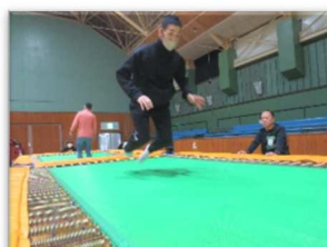
トランポリン挑戦