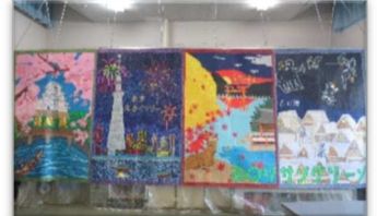
今年のテーマは春夏秋冬