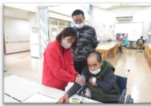
看護師による健康チェック