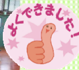
総合2位だったけど、ばんざーい、バンザーイ！！