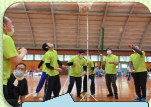
いっぱい玉入れようでえ～

羽っこゲーム、ボッチャの各競技は1位となり、総合でも2位という輝かしい成績を残しました。日頃のレクリエーションでも取り入れて頑張った結果ですね。