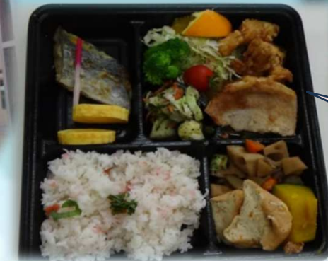
サングリーン恒例！！ 厨房特製の手作り弁当♪ おいしゅうございました♡