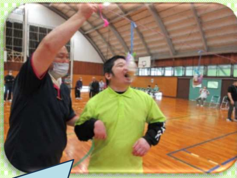
大きく口を開けて、あ～ん♡