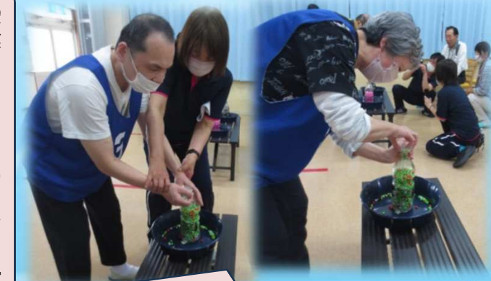
満水リレー（室内のためビーズで代用）