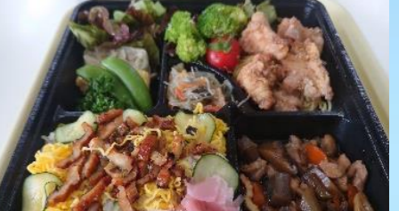
自慢の手作り弁当

みのりサングリーンの一大イベント『大運動会』が晴天の中行われました。ご利用者様の選手宣誓から始まり、「ラジオ体操、玉入れ、満水リレー、飲食リレー」と皆さん、真剣に取り組まれました。職員による「飴探しリレー」は初めて取り入れた競技です。どうですか?きれいに仕上がりましたか?新型コロナが5類に移行されたことによりマスクを外し、自然の空気を吸いながら開放感を味わっていただき、テラスでは皆さんの笑顔がはじけていました。(^^)/ 厨房職員による自慢の手作り弁当がとてもおいしく、皆様大満足されてました。