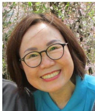
新 全 美京 介護員