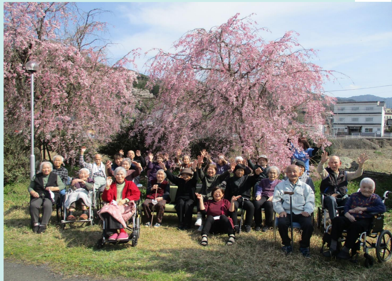
関金ラジュームのしだれ桜