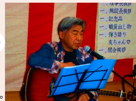
『友ちゃん♡』さんに来ていただき、童謡やなつかしい歌謡曲を弾き語りされ、ご利用者様も一緒に歌われたり手拍子をされたりして楽しんでおられる姿が見られました。またクイズと景品もあり喜ばれました。