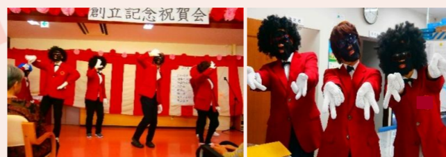
職員によるシャネルズ♪