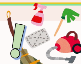
ピカピカにするぞ~