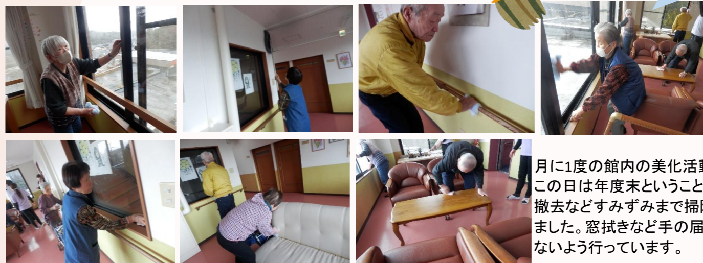
月に1度の館内の美化活動の様子です。この日は年度末ということもあり、掲示物の撤去などすみずみまで掃除をしてくださいました。窓拭きなど手の届く範囲で、危険がないよう行っています。