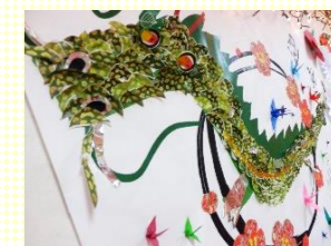
(編集担当 : 佐々木)

あけましておめでとうございます 天候にも恵まれ、穏やかにお正月を迎える事ができました。 施設内は、12月に作成した掲示物も飾り、華やかになりました。 何をするにもご利用者の知識とアイデアに助けを頂きながら楽しく活動を行っています。辰の鱗もご利用者のアイデアなんです!! 2024年も楽しい事が盛り沢山!! 次回広報誌をお楽しみに♪ 今年も関金インターケアハウスをよろしくお願いいたします(^ ^)