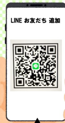
関金インターケアハウス QRコード