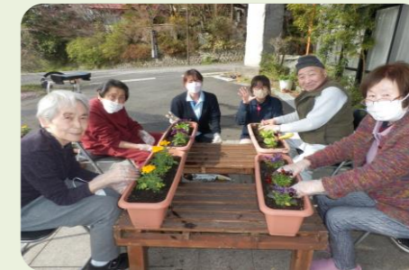
クラブ活動(花植え)