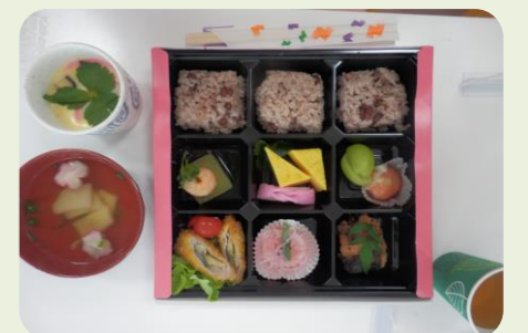
♪ 専門スタッフによる行事食♪