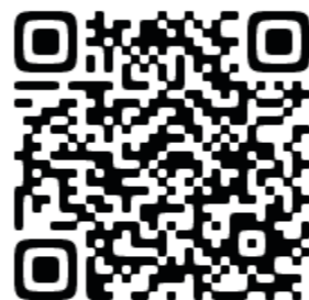
関金インターケアハウス QRコード