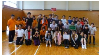
〈三園保護者会球技大会〉