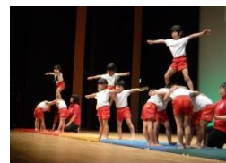
〈おたのしみ交流発表会〉