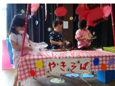
〈異年齢交流(夏祭り・秋祭りごっこなど)〉