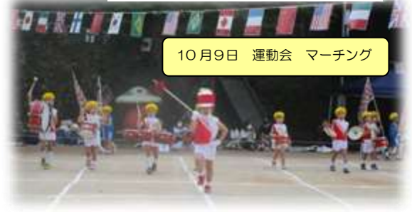
10月9日 運動会 マーチング