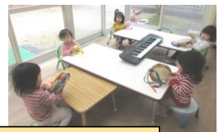
りす組さん 楽器遊び♪

・新型コロナウイルス、インフルエンザ等の感染症予防を家庭でも心がけていきましょう。