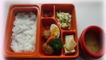
お昼の配食弁当（お汁付）