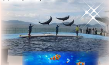
瀬戸内海を望みながら楽しむイルカショー!