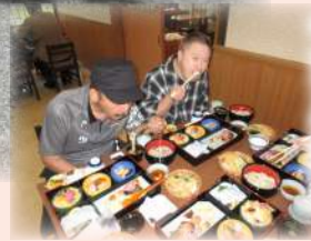
今年は栗林公園内にある「小松亭」にて、昼食をとりました。やはり香川県! 美味しい讃岐うどんが、付いていました!