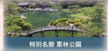
特別名勝 栗林公園