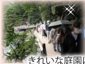
きれいな庭園に癒されます(#^.^#)