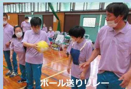
ボール送りリレー