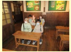
昔の教室で「はらこい」