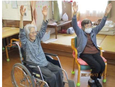
みんなでリハビリ体操！