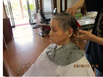
出張美容でさわやかな髪型に。