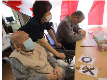
○×クイズ どちらにします？

今年で11回目となる開設記念祭。昨年同様ボランティアさんの参加はありませんでしたが、それに代わる企画で楽しんでいただきました。