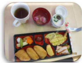
お楽しみメニュー