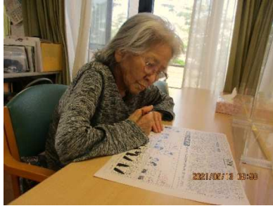
パズルに挑戦 私にとっては朝飯前よ！