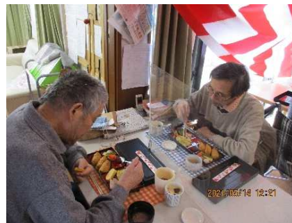
皆様、お味はどうですか？