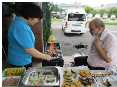
美味しそうなお肉！