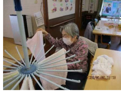
タオル干し お手伝いありがとうございます。