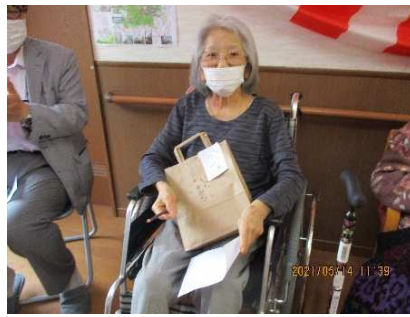
ビンゴゲームで景品ゲット！