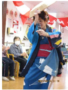
毎回場を盛り上げていただき、ありがとうございます。