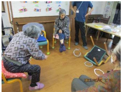
輪投げゲーム 思ったより難しいわ！