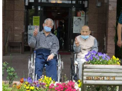
天気の良い日は、きれいな花を 愛でながら日光浴。