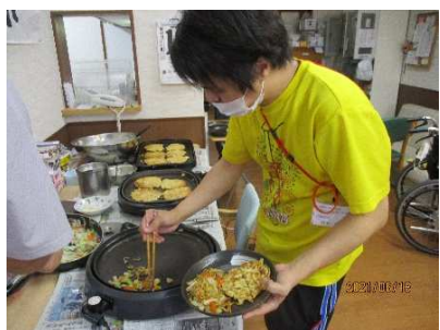
どれどれ、味見をしてみようかな。