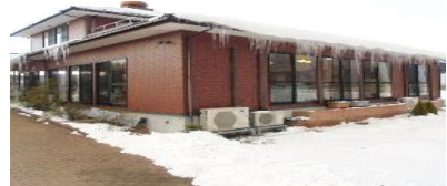
久しぶりの「つらら1m超え」

朝夕はまだ冷え込みますが、日差しは春めいてきました。季節の変わり目は不安定な天候が続きますが、くれぐれもお身体をご自愛ください。