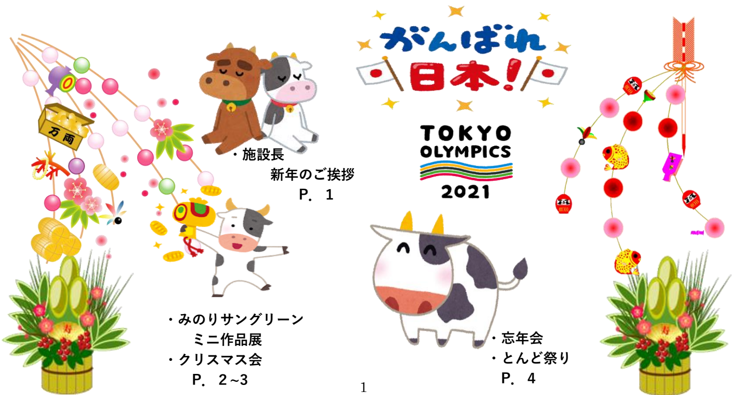
・施設長 新年のご挨拶 P. 1