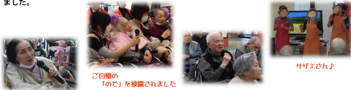
ご自慢の「のど」を披露されました

2月4日、新年のお祝いのために「ロイヤル新年会」を行いました。ご利用者様代表の方のカラオケ大会や、職員による歌や踊りの余興を楽しんでいただきました。