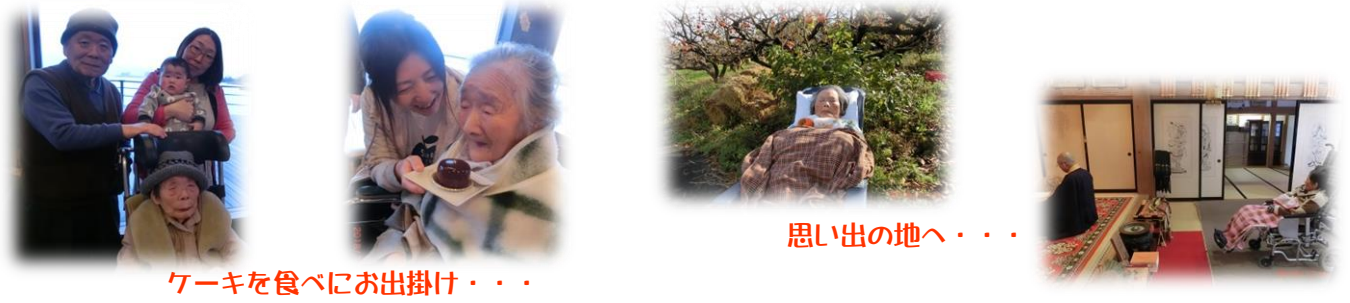
ケーキを食べにお出掛け・・・

スターロイヤルで取り組んでいる「スペシャルデー」。ふるさとや、思い出の場所を訪れる、行きたい所に行ってみる。十人十色のご希望に添えるよう、ご本人様そしてご家族様にとって「特別な日」となるよう、お手伝いをさせていただきます。