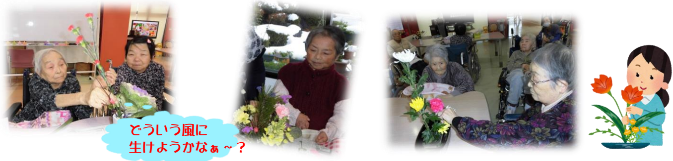
どういふ風に生けようかなあ～?

12月30日に「生け花クラブ」を行いました。今回はお正月を迎える準備として、松や千両といった縁起の良いものを中心に皆さまが思い思いに生けられました。