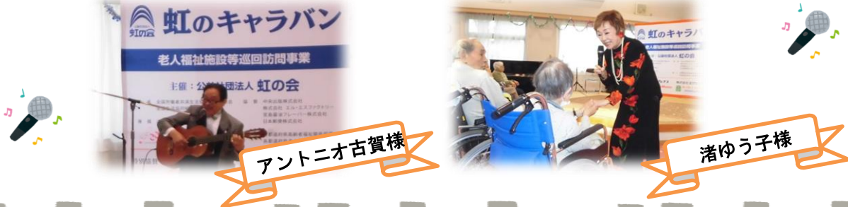
アントニオ古賀様

11月20日に公益社団法人虹の会様による、老人福祉施設巡回訪問事業「虹のキャラバン」。今回は当施設にアントニオ古賀様と渚ゆう子様が来訪され、歌や演奏を通して笑顔と元気を届けてくださいました。有名人のご登場に、涙ぐみ喜ばれるご利用者様もいらっしゃいました。