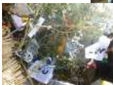
〈とんどまつり〉 今年一年の健康を祈りました。 書初めの習字も一緒に燃やしました。