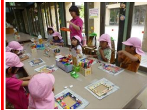
お楽しみ保育(さくら組)

8月2日(土)倉吉打吹まつり飛天 WASSO に『NISIKURA サマーキッズ』として、さくら組・すみれ組親子を中心に有志と職員で参加します。みなさまも沿道でご声援いただきますようお願いいたします。踊り開始 17:35～