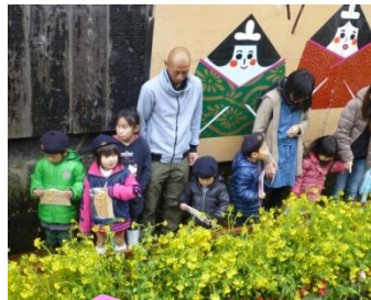
4月6日(日) くらし打吹流しびなに参加しました。願い事がかないますように！

あたたかい風が心地よい穏やかな季節になりました。子どもたちは新しい環境にも慣れ、毎日元気に「おはようございます」と登園する姿が見られます。また春の自然の中でのびのびと体を動かして遊んでいます。5月はこいのぼりやツバメのように元気に羽ばたいて遊びたいですね。