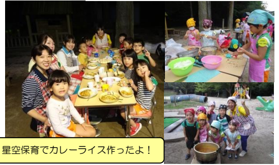
星空保育でカレーライス作ったよ!

11月は寒さや病気に負けない元気な体作りをしていきます。家庭でも、規則正しい生活、しっかり栄養をとるなど、心がけていきましょう。