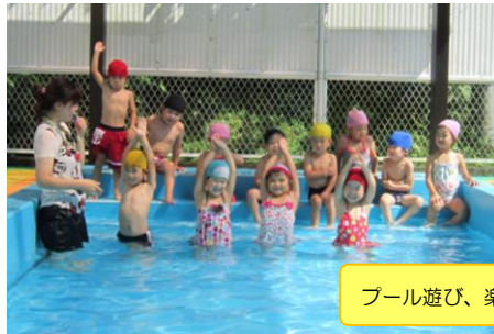
プール遊び、楽しかったね!

日時：9月18日(日) 午前9時から 場所：向山保育園 園庭 (雨天の場合は、社小学校体育館 時間：9時30分～) ♪子ども達の成長を見ていただくことも、家族と一緒に楽しみましょう。 未就園児・卒園児・祖父母の競技もあります。