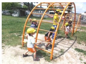
小遠足 楽しかったよ。