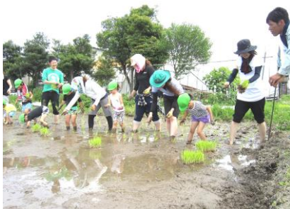
はと組親子会で田植えをしたよ。