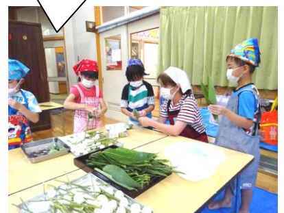
ちまき作り 6月9日(木)