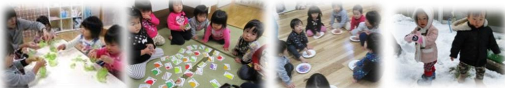
寒くても元気いっぱい! 戸外遊び、雪遊び、お正月遊びを楽しんでいます。