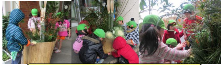
今年もいろいろな事にチャレンジしていきます！ 今年もよろしくお祈りします。