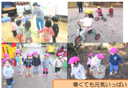
寒くても元気いっぱい！向山っこ！！