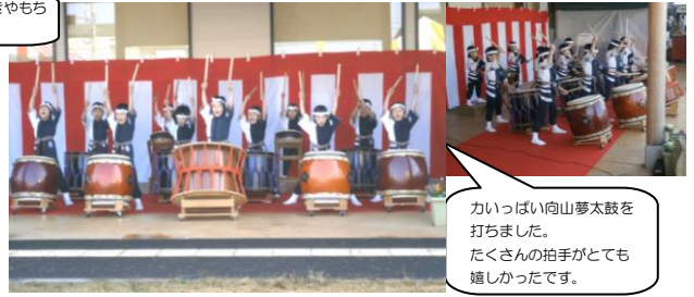
かいっぱい向山太鼓を打ちました。たくさんの拍手がとても嬉しかったです。