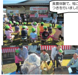
食農体験で、稲こきやもちつきを行いました。