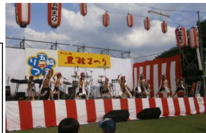
元気にライジングを踊りました。