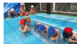
プール遊び 楽しいよ。