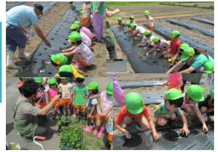
とうもろこしや枝豆の種まきや苗植えをしました。