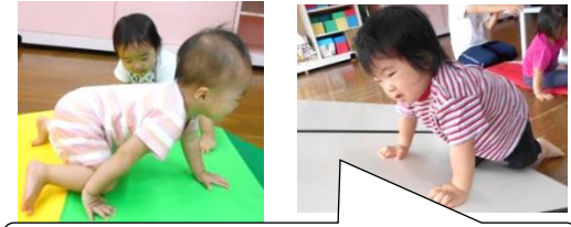
体をいっぱい動かして運動遊びを楽しんでいます。

【衣替えについて】 10月15日(月)~31日(木)は、衣替え移行期間です。ひまわり組以上は長袖園児服での登園をお願いします。