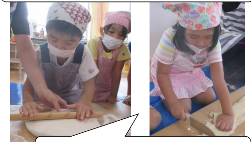
すみれクッキングでうどん作りをしました。