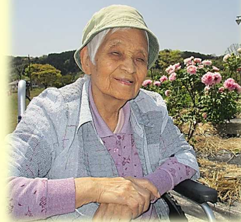
燕趙園の牡丹園にて