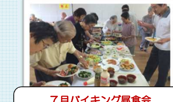
7月バイキング屋食会 毎月の屋食会の中でも、バイキングは皆さんに大人気です。