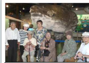
境港 海とくらしの史料館 大きなマンボウにびっくり!!