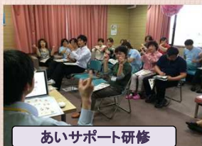
あいサポート研修