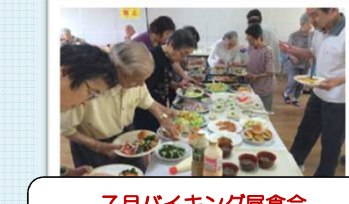
7月バイキング屋食会 毎月の屋食会の中でも、バイキングは皆さんに大人気です。