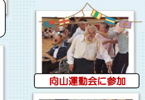
向山運動会に参加