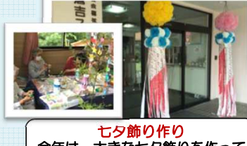
七夕飾り作り 今年は、大きな七夕飾りを作ってみました！すごーい！