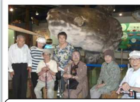
境港 海とくらしの史料館 大きなマンボウにびっくり!!