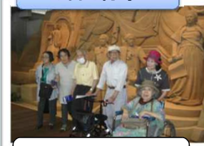
鳥取砂丘 砂像美術館 砂像の見事さにうっとり♡