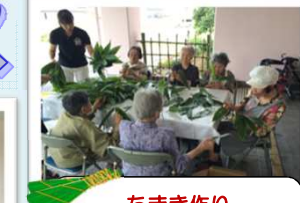
ちまき作り 玄関にて笹の仕分けをしました。楽しかったなあ♪