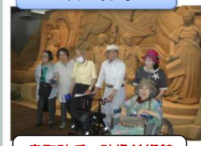
鳥取砂丘 砂像美術館 砂像の見事さにうっとり♡