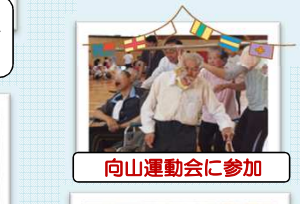
向山運動会に参加