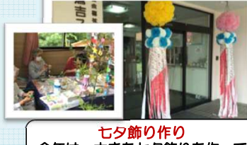
七夕飾り作り 今年は、大きな七夕飾りを作ってみました！すご〜い！